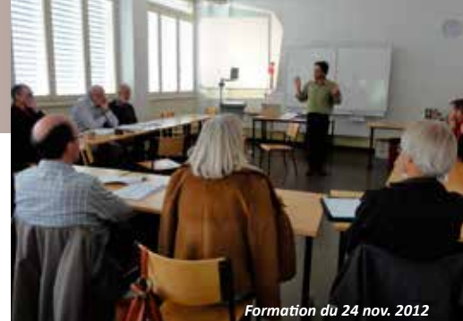
Formation du 24 nov. 2012

Durant la deuxième partie de l'année 2012, le comité a planché sur la création d'une instance chargée d'analyser les rapports financiers remis avec les rapports intermédiaires et finaux envoyés par les associations membres conduisant un projet soutenu par la fédération. Cela s'est fait conformément aux statuts de Valais Solidaire qui mentionne déjà cette commission, sous le nom de «Commission de contrôle financier». (CF). Celle-ci agira en étroite collaboration avec la Commission technique (CT) et décortiquera les charges et dépenses des associations